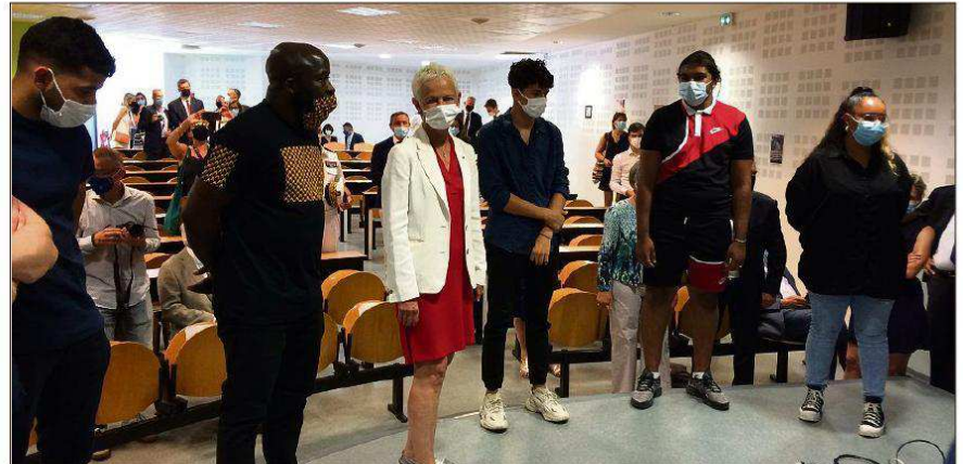
Lors de sa visite, hier, la ministre Brigitte Klinkert (au centre) n'a eu de cesse de motiver les jeunes en formation à l'Ecole de la deuxième chance.