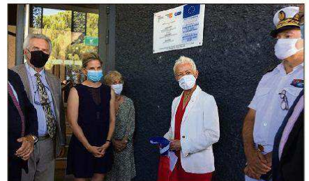
La ministre a également procédé à l'inauguration de l'école, en présence de nombreuses personnalités. M. G.

fin aux jeunes, leur indiquant que le site ljeune1solution.gouv.fr propose actuellement 20 000 emplois dans le Var, dont un millier à Toulon. Sans oublier de relayer le message du gouvernement : « Il faut vraiment vous faire vacciner ; il n'y a que comme ça qu'on va sortir de cette crise dont nous souffrons tous, et vous en particulier ».